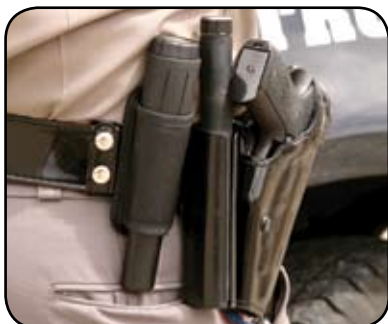
Ballisztikus tartó; könnyedén övre fűzhető.

Korlátozott, 24 hónapos alkatrész és labor