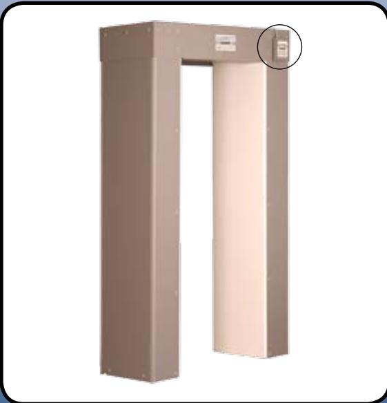
Kijárat a vezérlővel