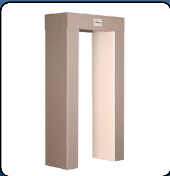
Kijárat: a vezérlő a felső dobozba zárva.